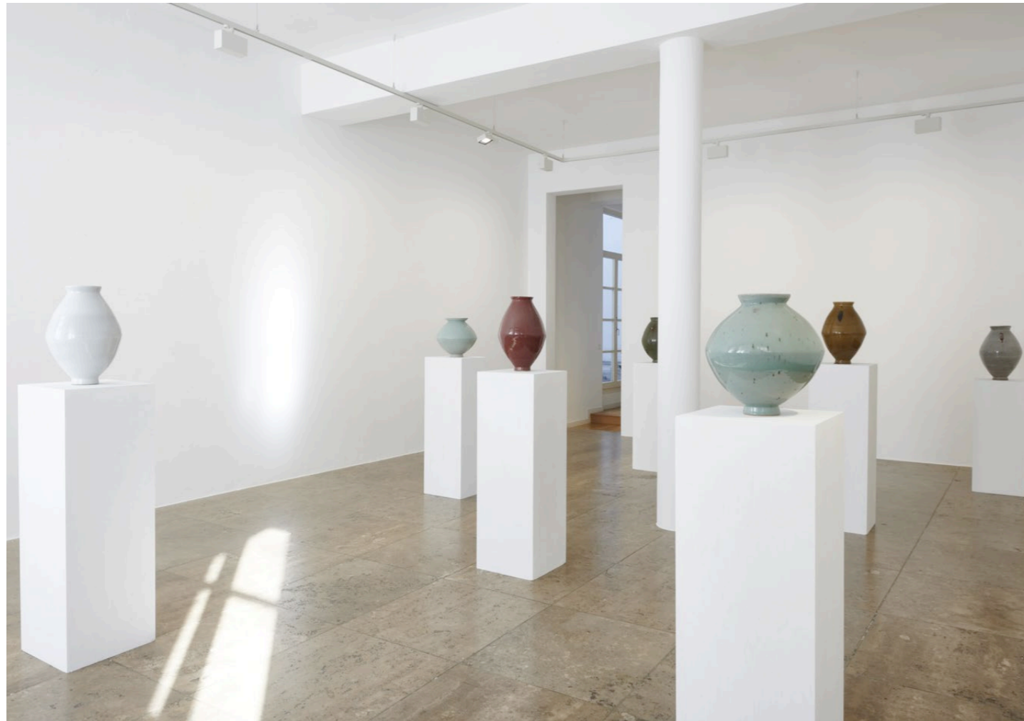
Young-Jae Lee, Spindelvasen und Spinatschalen , Jahn und Jahn, Munich 2022