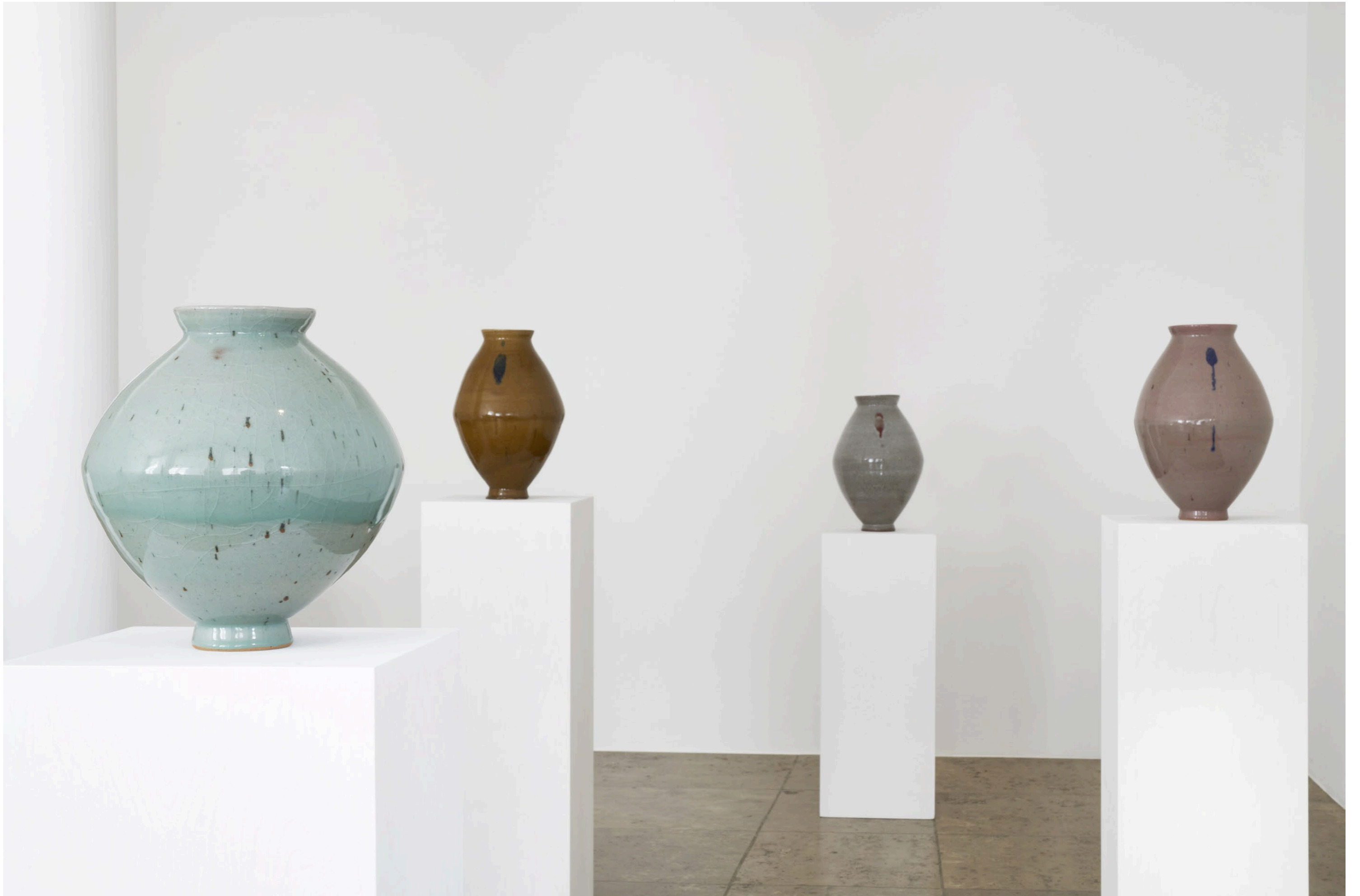
Young-Jae Lee, Spindelvasen und Spinatschalen , Jahn und Jahn, Munich 2022