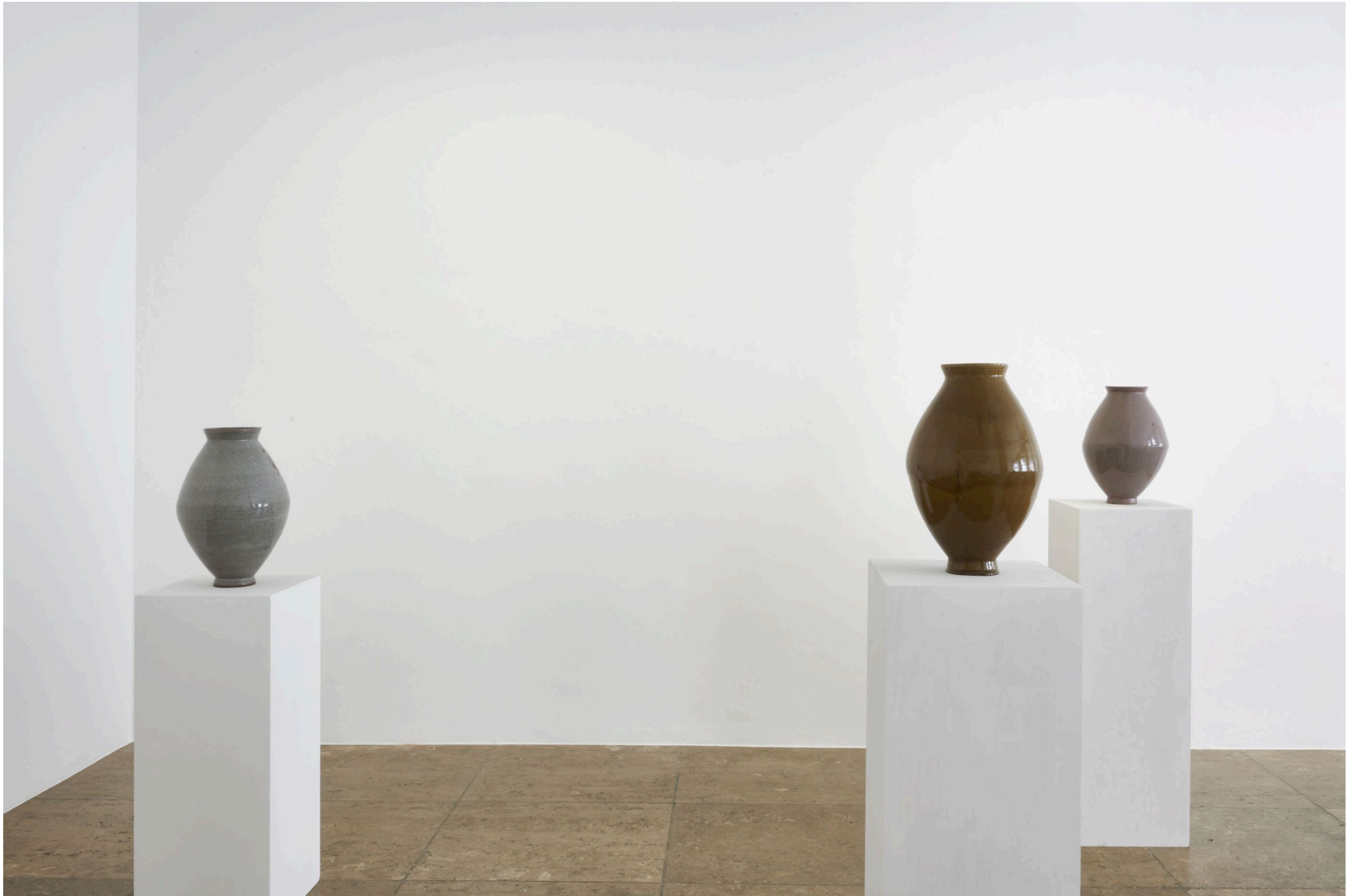
Young-Jae Lee, Spindelfasen und Spinatschalen , Jahn und Jahn, Munich 2022