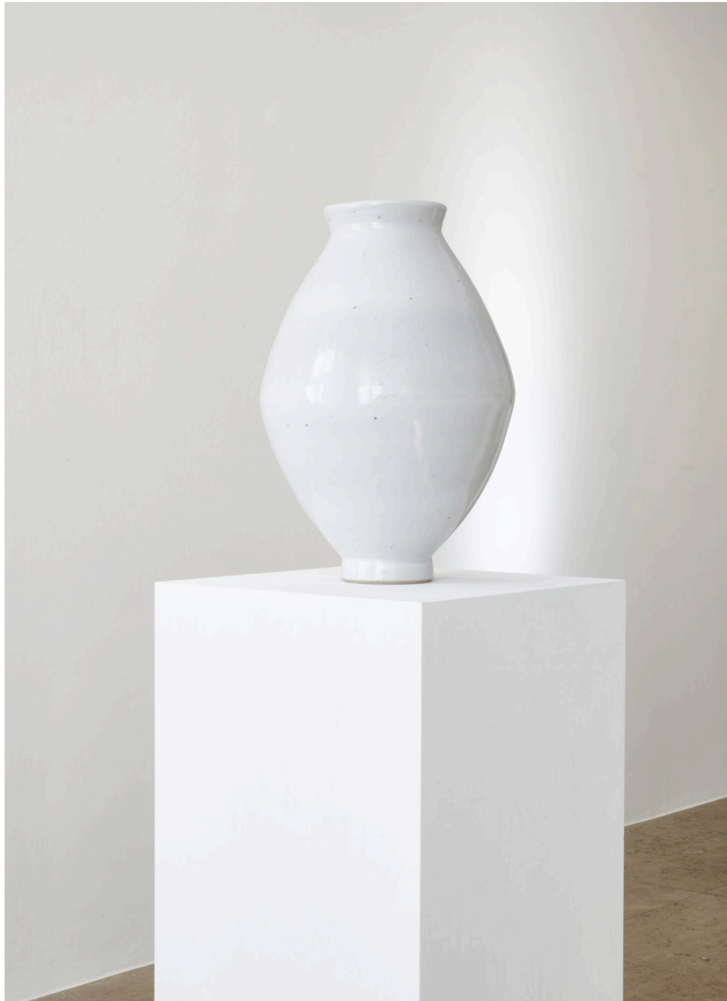
Young-Jae Lee, Spindelfasen und Spinatschalen , Jahn und Jahn, Munich 2022